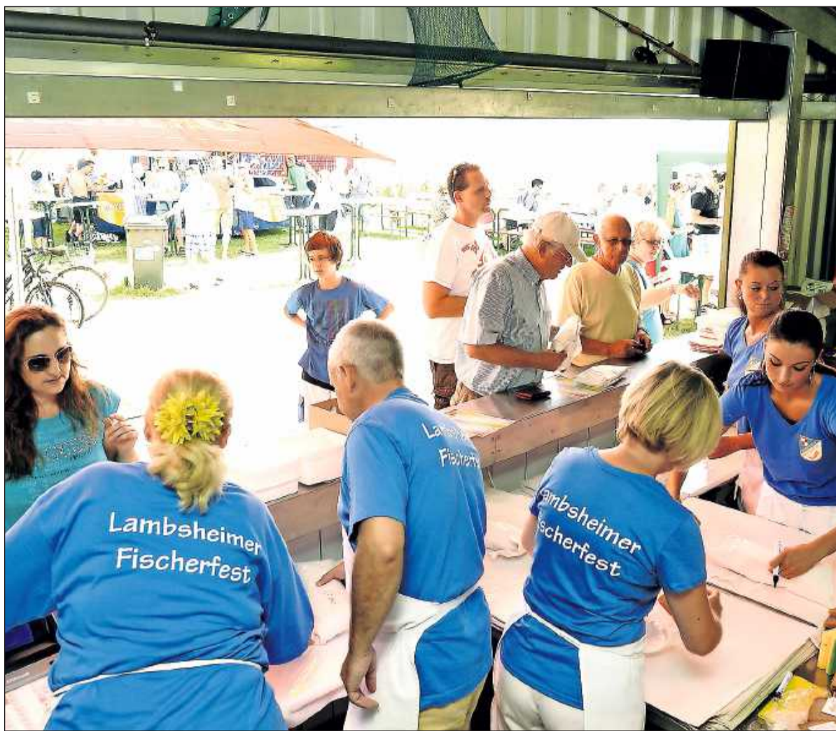
Ein kleines Wunder: Der Sportangler-Verein kann für sein Fischerfest auf bis zu 200 freiwillige Helfer bauen. Viele davon sind weder Mitglied im Verein noch bekommen sie Geld für ihre Mithilfe. Unser Bild vom Fest am Lambsheimer Weiher stammt aus dem Jahr 2012.

Lambsheimer Fischerfest von Freitag bis Montag, 15. bis 18. August, am Nachtweideweiler. Beginn des Zeltbetriebs ist am Freitag und Samstag um 16 Uhr, am Sonntag und Montag um 11 Uhr.