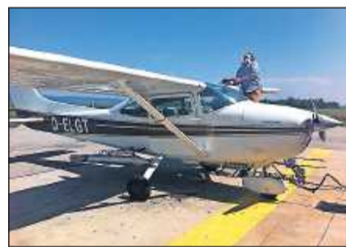
Der Flieger versprüht Silberiodid, um so die Bildung großer Hagelkörner zu verhindern.

ten Vorder- und Südpfalz zum Einsatz kommen. „Dadurch können wir nun auch schneller an zwei Hagelfronten sein“, so Gerling. Zudem könnten auch große Gewitterfronten besser bedient werden. Ein Wetterradar in Karlsruhe scanne im Fünfminutentakt die Region, erklärt Gerling. Die Piloten wüssten so schon Stunden vor einem Gewitter, ob sie sich für einen Einsatz bereit machen müssen. (hn)